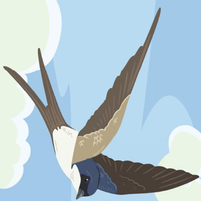
Le hirondelle des fenêtres