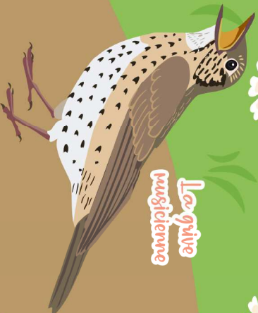
La grive musclienne