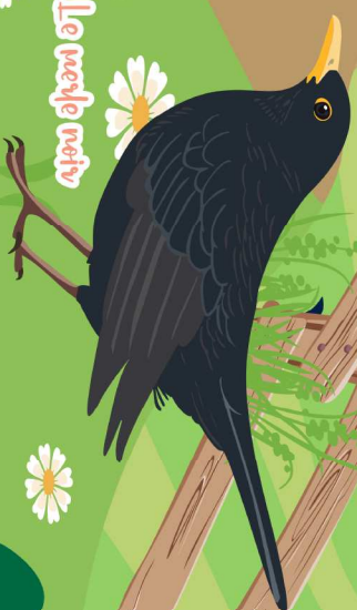
Le merle noir