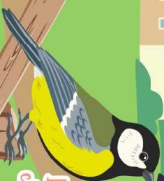
La mésange charbonnière