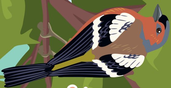
Le pinson des arbres