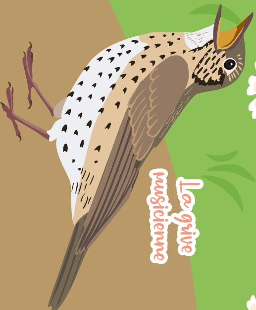
La grive muscienne