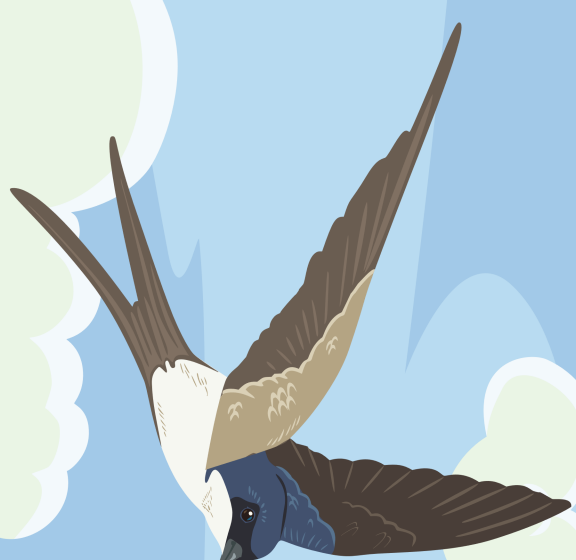
La hirondelle des fenêtres