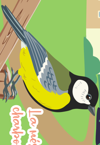
La mésange châpennière